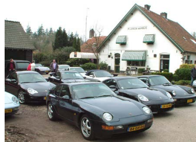
< Planken Wambuis is een uitstekende locatie voor activiteiten, zoals hier een Porsche dag.