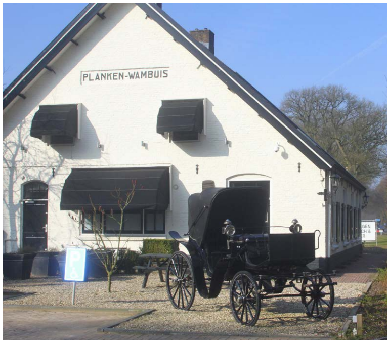
< Een oude koets sierde de entree op de parkeerplaats